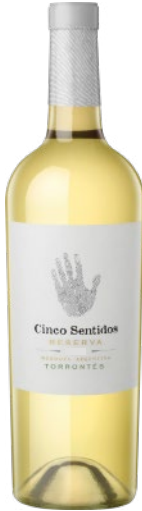
TORRONTÉS RESERVA 2019 BRANCO | WHITE | BLANC