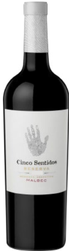
MALBEC RESERVA 2018 TINTO | RED | ROUGE