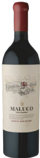
MALUCO FAMILY RED BLEND TINTO | RED | ROUGE