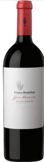
GRAN RESERVA 2015 MALBEC, PETIT VERDOT, CABERNET SAUVIGNON TINTO | RED | ROUGE